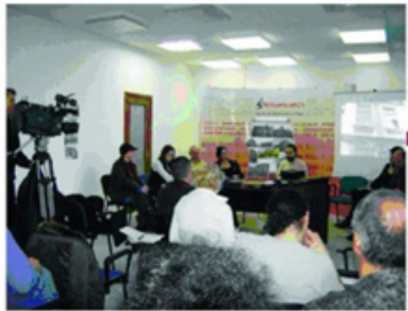
Conferinta Active Watch