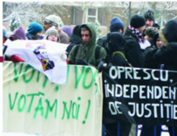
Miting la Primarie