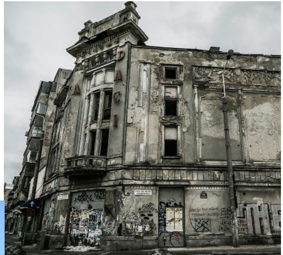
Cinema Marcon / Dacia , 1926 (arh. Ctin Cananău) retrocedată 2008, abandon / de vânzare