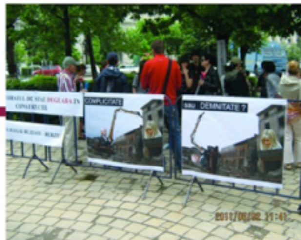
Miting - MDRT

Bucureștii Alternativ 1 Atelier interdisciplinar